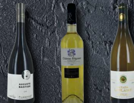
Petra Veridis : Auguste Bastide Régusse : Régusse blanc La Blaque : Réserve Blanc

Per assistervi nella vostra scelta, abbiamo selezionato un vino per ogni tenuta, per aiutarvi a creare il perfetto abbinamento "Banon e vino".