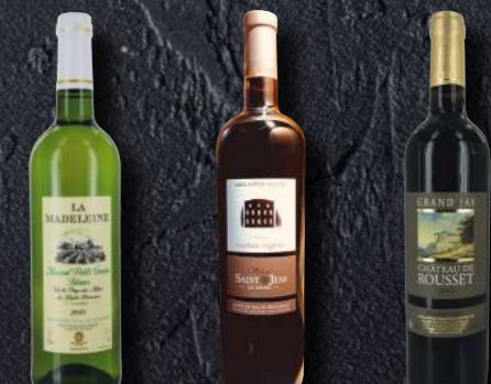
La Madeleine : Muscats petits grains Château Saint-Jean : Pimayon Vieilles Vignes Château de Rousset : Cuvée Grand Jas